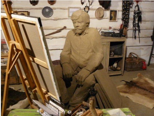
Dit jaar was het thema: Rien Poortvliet.

Om 13.15 uur vertrok de nietploeg met partners, de koffiegroep en de redactie van het Kerkenster vanaf het "Ontmoetingsplein" met 25 deelnemers en 6 auto's richting Garderen om aldaar een bezoek te brengen aan de zandsculpturen. (nog even voor alle duidelijkheid: dit uitje van de vrijwilligers is op eigen kosten)