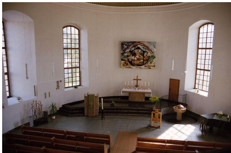
Kerk in Dessau